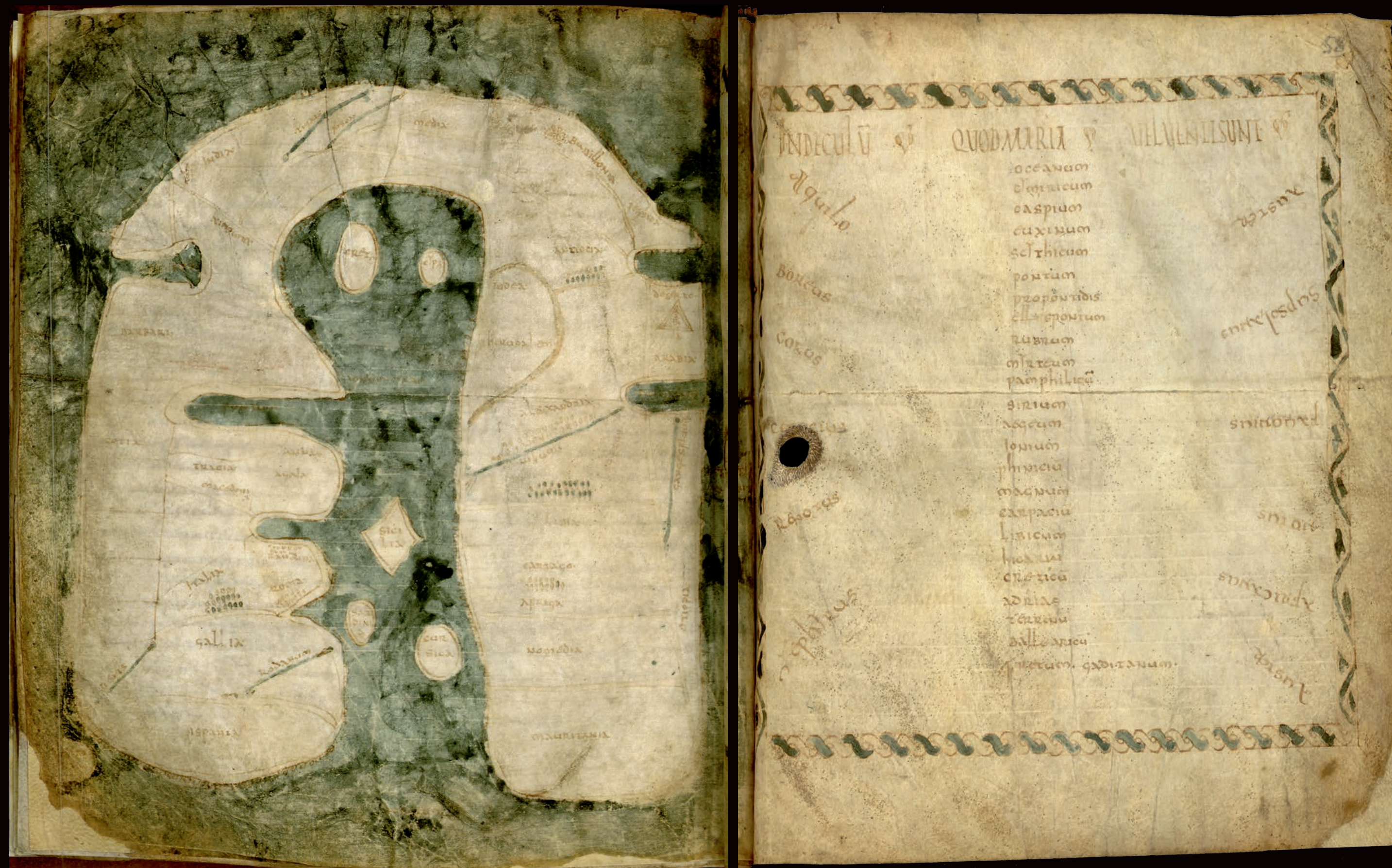
CARTE DU MONDE PHOTO 1

Le manuscrit est en excellent état de conservation.